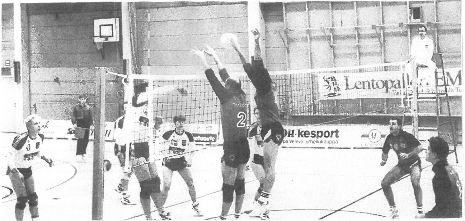
Jankko osoitti Hirvihovissa olevansa kaikessa Poria edellä.