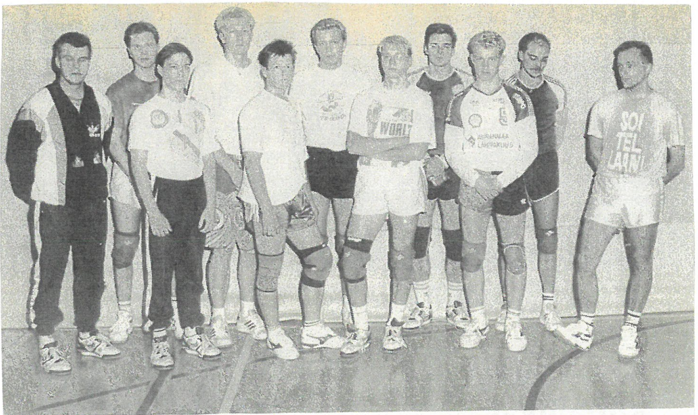
Loimaan Jankon lentopallon kakkossarjajoukkue nuorentui melkoisesti A-poikien siirtyessä sarjapelaajiksi.